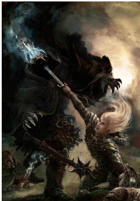
Art by Sam Waulu.

Этот сценарий отражает относительно положительную сторону такого рода сущностей. Скандинавские примеры подобных сущностей, haugbúar [ «ведьмаки», обитатели курганов. – Прим. пер. ] и родственные им явления, демонстрируют нам разнообразный с точки зрения морали набор поступков, от мертвой женщины, которая вылезла из гроба и приготовила пищу для людей, везших ее хоронить, – по дороге им дали кров, но забыли накормить – а потом упокоилась в своей могиле, до людей, которые и при жизни были злы, а после погребения сделались гораздо злее прежнего – как, например, существо, похожее на Гренделя, в «Саге о Греттире». Толкин, безусловно, был знаком с литературой такого рода, поскольку интригующие параллели и различия «Саги...» и «Беовульфа» широко известны (Shippey, 1982/1992, pp. 98–99); (Chambers, 1921).