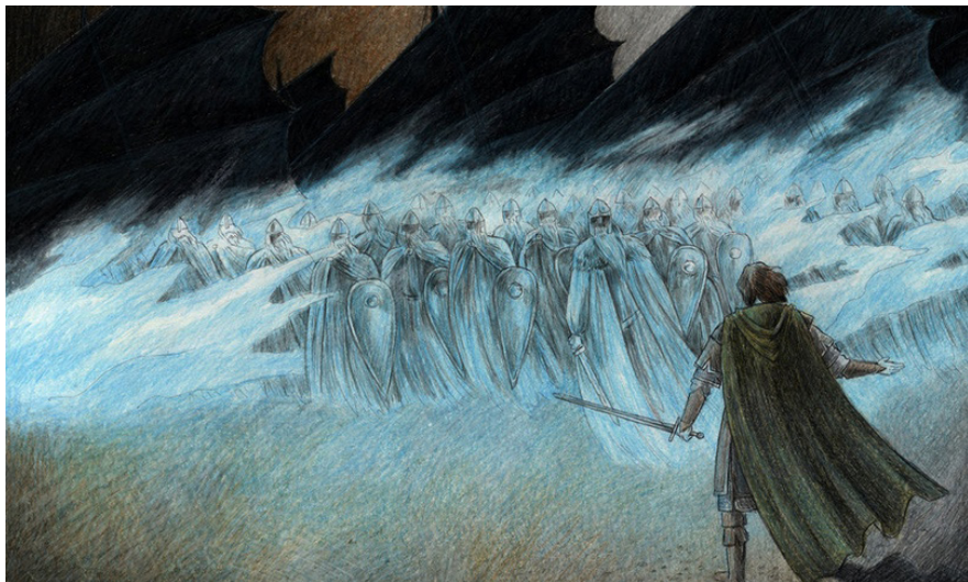
Art by Lída Holubová.

Первый важный момент заключается в том, что, несмотря на тождественные словарные определения, «тени» ( wraiths ) и «призраки» ( ghosts ) – это две разные вещи. Лучшим примером призраков у Толкина могут выступить Мертвецы Дунхарроу. Они, попросту говоря, мертвы; их телесные обличья уничтожены, они больше не могут влиять на физический мир. Лэголас в своем рассказе о пути из Дунхарроу в Пэларгир отмечает, что он не знал, способны ли клинки Мертвых наносить вред, но это было и неважно, поскольку единственным оружием, в котором они нуждались, был страх ( LotR/RotK , кн. V, гл. 9 – «Последний Совет»).