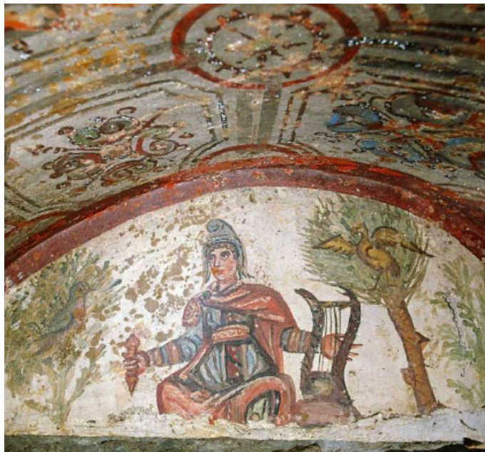
Орфей. Фреска из катакомб Свв. Петра и Марцеллина (Рим, IV в.н.э.)

Наконец, в таком произведении средневековой литературы, как английское лэ конца XIII – начала XIV века «Сэр Орфео», эта легенда трансформируется в духе жанра лэ, опиравшегося на кельтский мифологический материал. Орфей в ней предстает как король Орфео, а смерть его жены Эуридис заменена на ее чудесное похищение королем фей (3). Орфео, убитый горем после исчезновения жены, отрекается от трона и уходит в глушь, однако, случайно встретив Эуридис во время охоты короля фей в его свите, решает спасти ее любой ценой. Отправившись под видом бродячего менестреля в страну фей, он очаровывает ее короля своим пением и требует в качестве награды освобождения Эуридис.