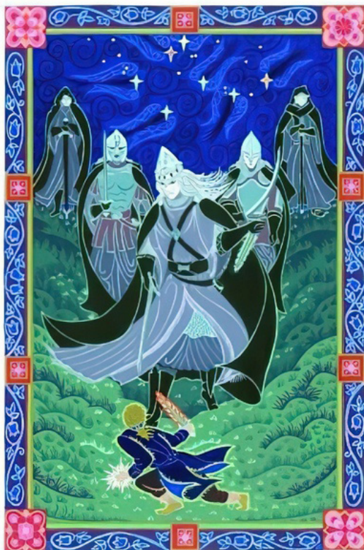
Art by Hareth nic Handir.

Эта иллюстрация «Фродо и Тени Кольца на Заветри» принадлежит моей кисти и создана в 2000 г. Материал – гуашь, исходный размер примерно соответствует формату А3 или 12x16 дюймов. Мой муж, который занимался фехтованием в школьные годы, помог мне